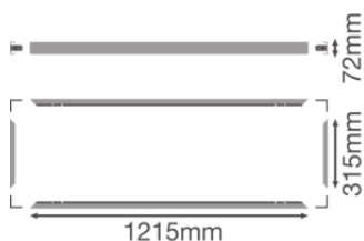
PL 1200X300 SF MOUNT KIT H70 VAL