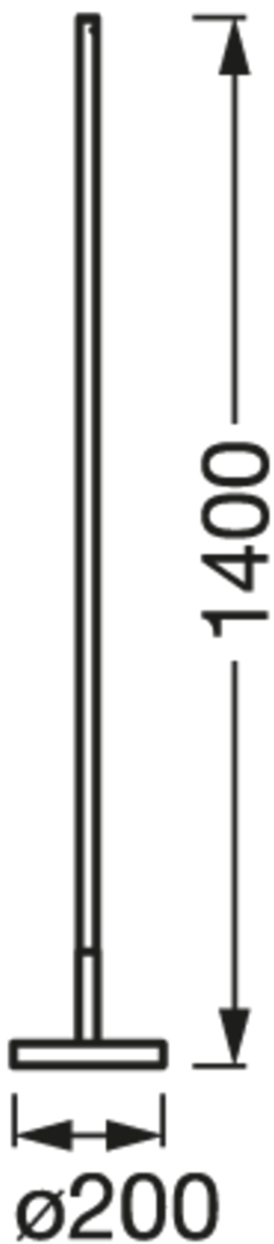
SMART WIFI FLOOR ROUND