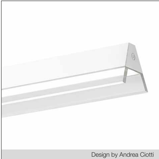
Design by Andrea Ciotti