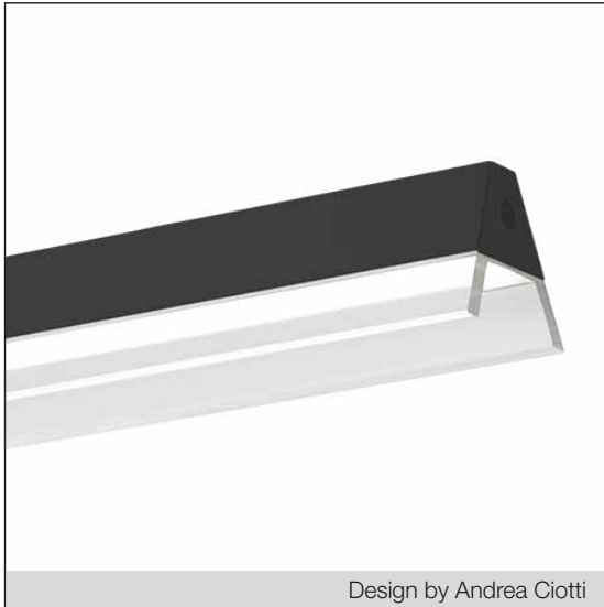
Design by Andrea Ciotti