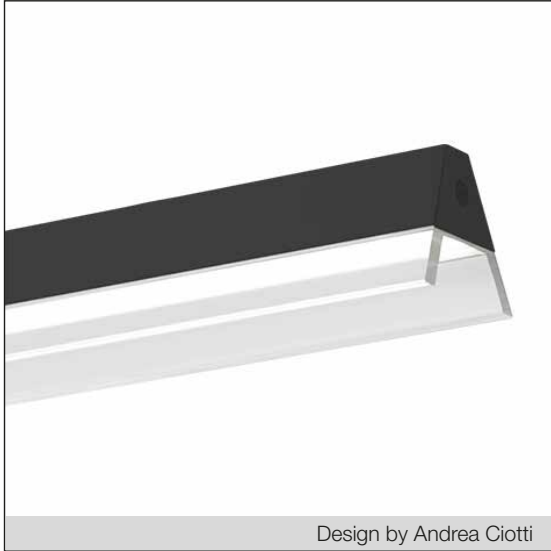
Design by Andrea Ciotti