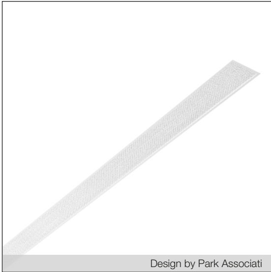
Design by Park Associati